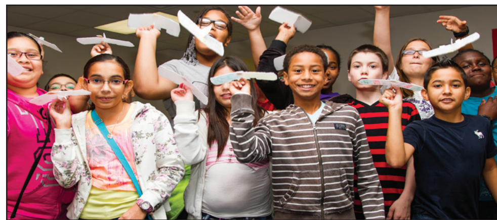
Los estudiantes aprendieron principios de aerodinámica y luego aplicaron su conocimiento para construir papalotes, cohetes y otros objetos relacionados a la aviación.

El 11 de julio de 2013, 275 estudiantes de Galena Park ISD participaron en la cuarta edición de NASA Verano de Innovación, un programa con duración de una semana dirigido a estudiantes que ingresarán del 6° al 9° grado para promover las destrezas de Ciencias, Tecnología, Ingeniería y Matemáticas (STEM, por sus siglas en inglés). Como una iniciativa continua de la Casa Blanca, el Verano de Innovación está diseñado como un campamento para que los estudiantes exploren, creen y experimenten. El campamento de siete días, dirigido por maestros entrenados para un plan de estudios innovador de